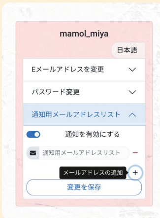
通知先メールアドレスを 追加できます。