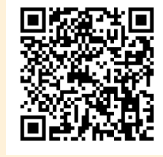
登録デモ *ナレーション付き