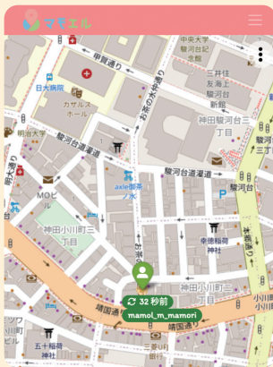
GPS端末の現在位置に 自動的にズームイン (1端末の場合)