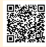
登録デモ *ナレーション付き